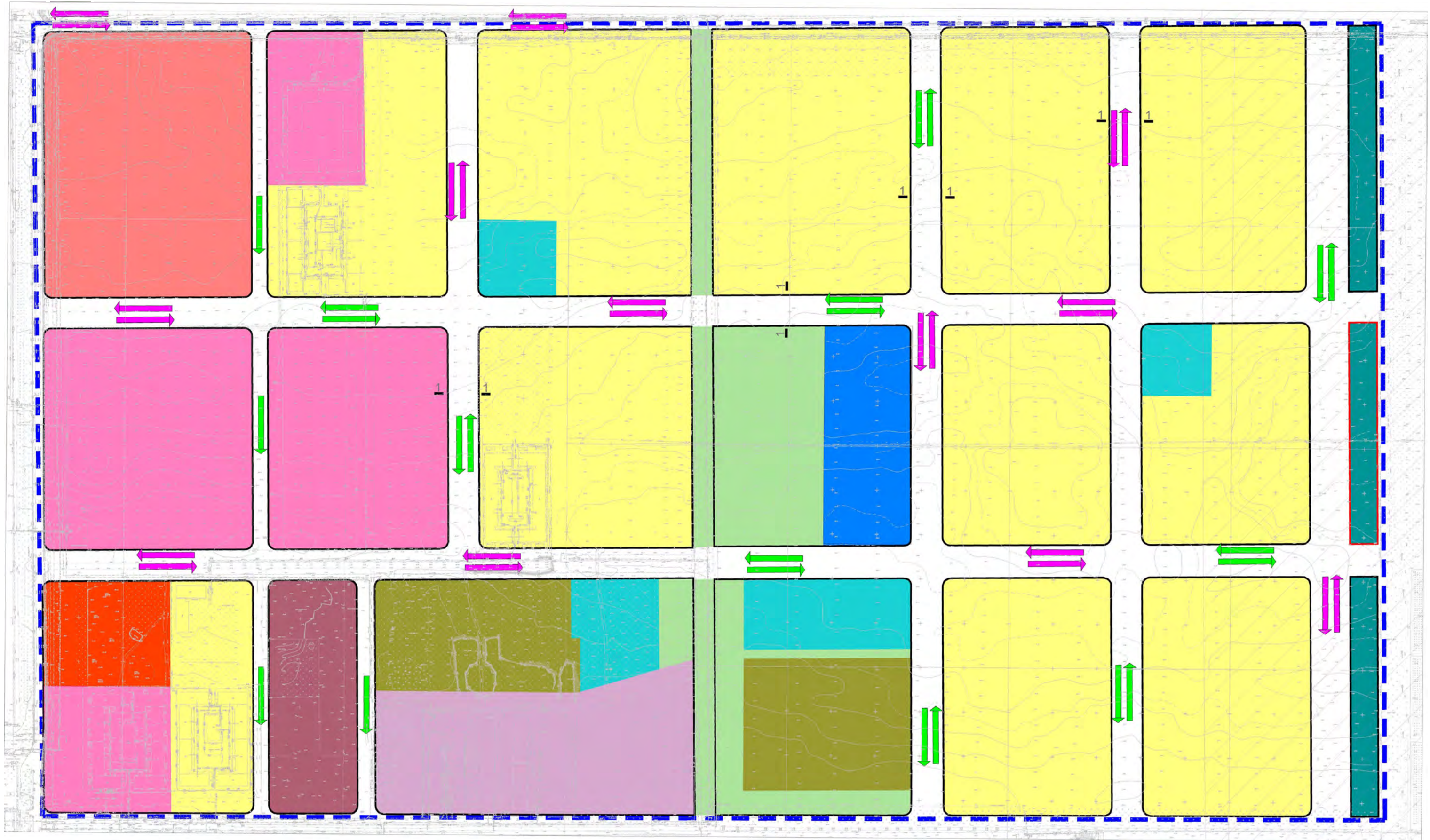
СЕЧЕНИЕ 1-1 УЛИЦА РАЙОННОГО ЗНАЧЕНИЯ РЕГУЛИРУЕМОГО ДВИЖЕНИЯ